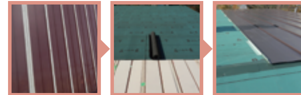
1. 胴縁 2. 断熱材・防水シート 3. 板金(平成ルーフ)